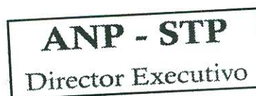
Orlando Sousa Pontes